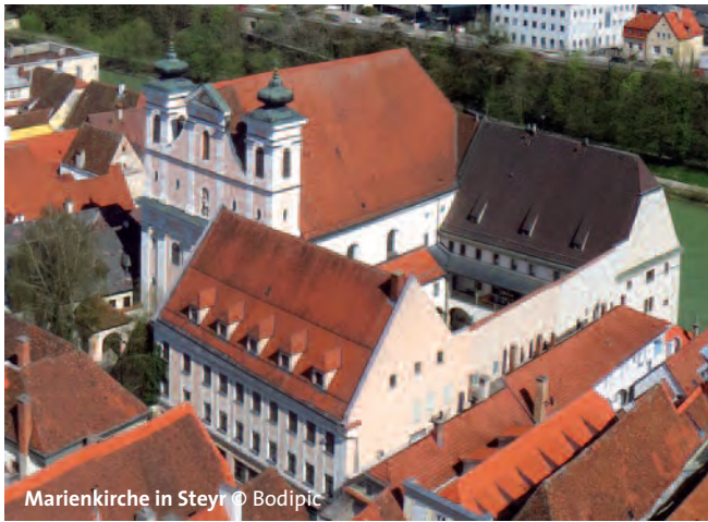
Marienkirche in Steyr