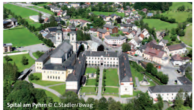
Spital am Pyhrn