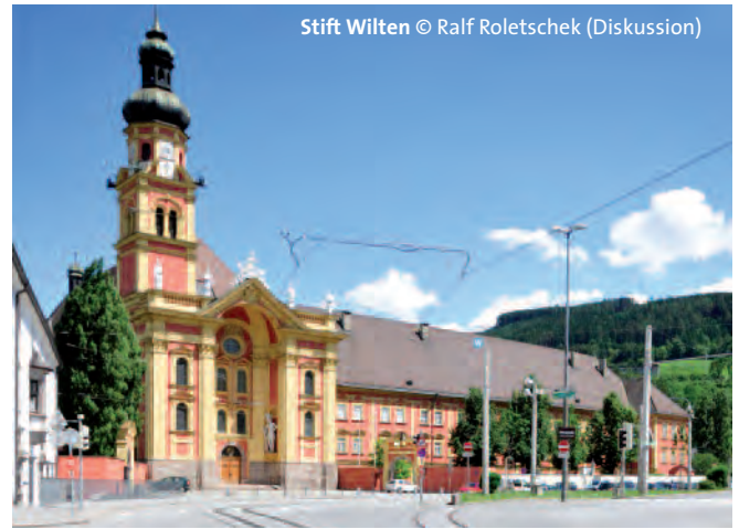
Stift Wilten